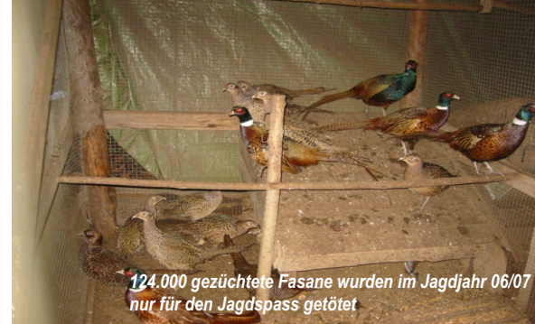
124.000 gezüchtete Fasane wurden im Jagdjahr 06/07 nur für den Jagdspaß getötet