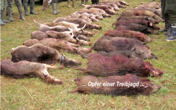
... Opfer einer Treibjagd ...