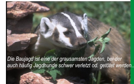
Die Baujagd ist eine der grausamsten Jagden, bei der auch häufig Jagdhunde schwer verletzt od. getötet werden...