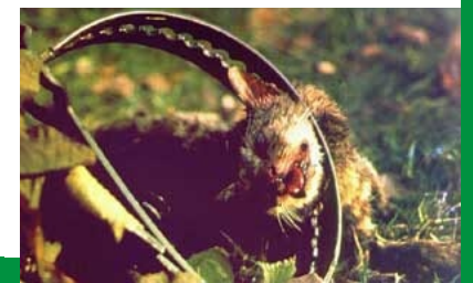
Fallen können nicht unterscheiden, wer oder was in die Falle geht. Es könnte auch Ihr Haustier sein ...