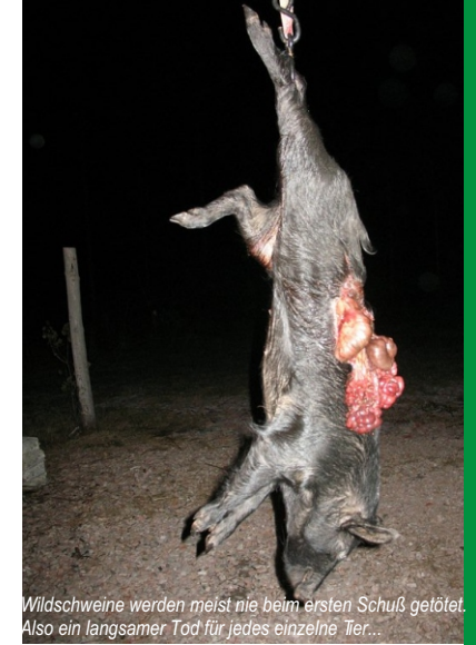
Wildschweine werden meist nie beim ersten Schuß getötet. Also ein langsamer Tod für jedes einzelne Tier...